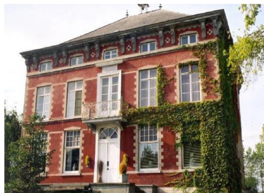
Figuur 7 Waar de hoevegebouwen van het Hof Terlenen in Rummen uit witgekalkte baksteen bestaan, is haar woongedeelte uit de tweede helft van de negentiende eeuw een waar herenhuis, opgesmukt met mooie versieringen.

De overige gebouwen van de vierkanthoeve getuigden ook van enig prestige. Waar bij kleine boerderijtjes het leefgedeelte vaak slechts uit één ruimte bestond met daarin een bedstede, was het woonhuis van de vierkanthoeve een waar boerenburgerhuis. (Zie figuur 7)