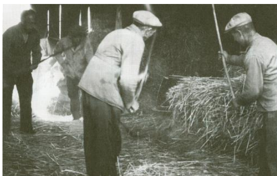
Figuur 3 Dorsen is het scheiden van de graankorrels van de aren. Nadat het graan in schoven was gedroogd op het veld werd het opgestapeld in mijten ofwel in de schuur. Tot na de Eerste Wereldoorlog was het manueel dorsen winterwerk dat plaatsvond in een overdekte plaats en op de dorsvloer. Wanneer het buiten vroom losten de graankorrels veel gemakkelijker uit hun aren. Juist door ons wisselvallige klimaat was de schuur de aangewezen plaats, ook al omdat de ongedorste schoven vaak in diezelfde schuur waren gestapeld.

tegelijktijd werken, zonder dat dit de andere activiteiten op de boerderij hinderde. (Zie figuur 3)