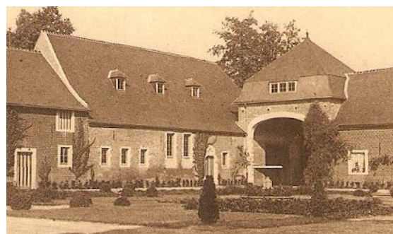
Figuur 6 Een ansichtkaart van de koer van het kasteel van Bets (1920-1930). Reeds in de dertiende eeuw stond er een motte. Het huidige gebouw is voornamelijk het resultaat van restauratiewerken uit de jaren 1920. Onder het dak van de monumentale poortgebouw zit een duiventil.

De toegangspoort van de vierkanthoeve kon een heus torengedebouw zijn met als toppunt van aanzien een duiventil. Het houden van duiven was lange tijd een privilege. (Zie figuur 6)