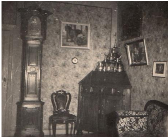
Figuur 8 Een foto uit de jaren 1940 van een hoekje van de "schoonkamer" van hoeve Keukses in Geetbets.

Het boerenburgerhuis had meestal een half ingezonken kelder als opslagplaats, een aparte keuken en woonruimte, aparte slaapkamers en tot slot een schoonkamer met de mooiste meubels, die enkel op speciale momenten of voor het ontvangen gasten gebruikt werd. (Zie figuur 8)