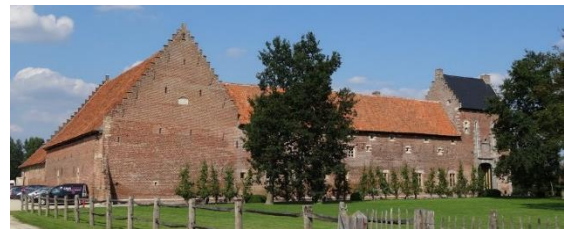
Figuur 2 Het zestiende-eeuwse Kasteel van Hoen in Rummen was vroeger volledig gesloten en omweld. Bovendien was het enkel toegankelijk via de toegangspoort met ophaalbrug. Vandaag is het kasteel verdwenen en bestaat de site nog uit drie beuken van het boerderijgedeelte en één toren van het vroegere kasteel.

Grotere hoeves kregen voornamelijk een gesloten opbouw rond een koer. Deze vorm had vele voordelen: de geslotenheid zorgde voor een goed toezicht over de boerderij. Verder kon de boer zijn hoeve volledig voor de buitenwereld beschermen door simpelweg de poort te sluiten. Zo was de hoeve veilig in woelige tijden. (Zie figuur 2) Bovendien bespaarde hij bouwmaterialen door de gemeenschappelijke bouwelementen. Hij beperkte zijn loopafstand van het ene naar het andere hoevedeel en kon ten slotte pronken met een prachtige hoeve. Aanzien en prestige speelde dus ook mee in het kiezen voor de gesloten vorm.