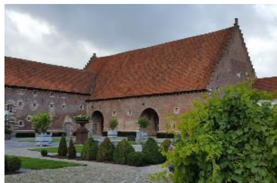
Figuur 5 De vroegere dwarsschuur van het Kasteel van Hoensloot telde minstens vier dorsvloeren. Het deel dat vandaag nog overblijft, telt er twee.

De meeste hoeves waren echter van kleiner formaat. Het is dan ook de dwarsschuur met slechts één dorsvloer die we het vaakst bij de kleine tot middelgrote vierkanthoeves in Zuid-Hageland terugvinden, vaak pal tegenover de monumentale inrijpoort.