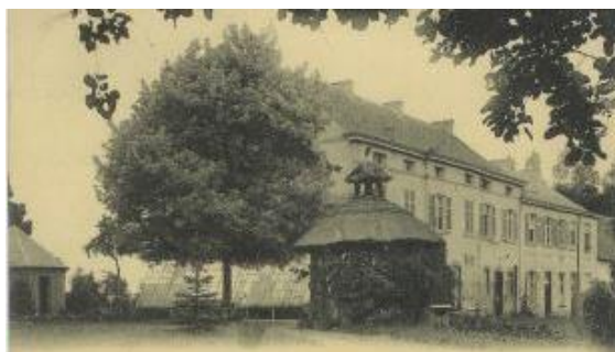
Figuur 9 Een aanzichtkaart van de Cisterciënzerinnenabdij van Oriënte, gesticht rond 1234 door Arnold VII, graaf van Loon en heer van Rummen. In de loop van de zestiende eeuw waren de Oriënten uitgegroeid tot één van de grootste vrouwencongregaties in de Nederlanden. Zo bezaten ze de Grazenmolen en de hoeves Terlenen, Schoonbeek, Ter Borg en het verdwenen Ter Vreundt. Onder de Franse overheersing in 1798 werden al hun goederen aangeslagen, als nationaal goed verkocht en grotendeels afgebroken.

De grootste der vierkanthoeves behoorden, samen met vele gronden, aan abdijen en de adel of burgerij. Deze hoeves stonden ofwel op het erf van de abdij, kasteel of herenhuis, ofwel apart, als plaatselijke "voorpost", uitgebaat door een hofmeier in het eerste geval en een pachter in het tweede. De gigantische tiendenschuren getuigen van de tienden (letterlijk één tiende van de oogst) die de plaatselijke bevolking aan deze machthebbers moest af staan in ruil voor hun bescherming.