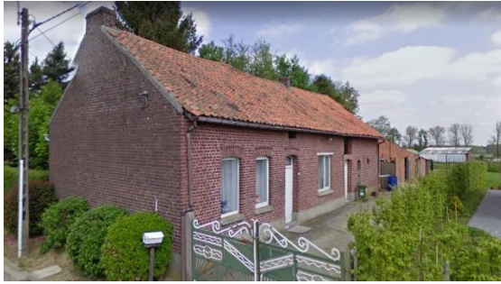
Figuur 10 Een langgevelhoeve op de Heirbaan 28 in Geetbets.

Hoewel deze hoevetjes in grote getalen aanwezig waren, is het niet eenvoudig om er onderzoek naar te doen. Enerzijds zijn ze meestal verdwenen. Omdat hun materialen van mindere kwaliteit waren, hebben ze de tand des tijds vaak niet overleefd. Bovendien zijn ze door hun geringe omvang sinds de jaren 1960 hun landbouwfunctie verloren en bijgevolg afgebroken of danig verbouwd. Anderzijds worden ze in de literatuur genegeerd. Ook als onroerend erfgoed worden ze vaak niet herkend. Informatie over de langgevelhoeve moet dus op een andere manier gevonden worden: via een zoektocht op het zicht door de straten en op basis van getuigenissen.